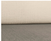
+ Tapicería Kapan