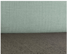
+ Tapicería Timor