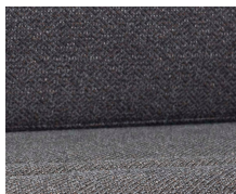
+ Tapicería Melia ○