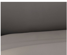
+ Tapicería de piel Collin ○