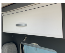
+ Mobiliario en diseño roble Amberes y gris Trace Dark