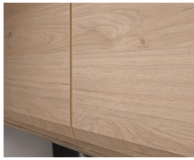
+ Mobiliario Nogal Nagano