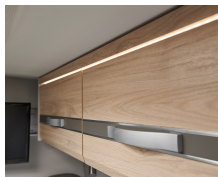
+ Mobiliario en diseño Nogal Nagano y gris Web