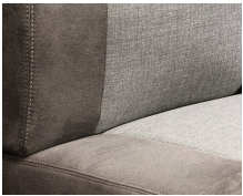
+ Tapicería Hygge