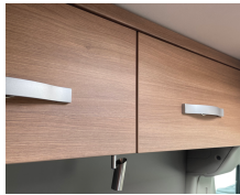
+ Mobiliario Cape Town