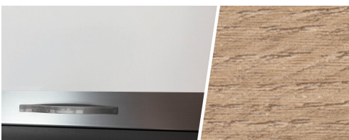
+ Roble Amberes