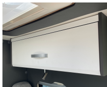
+ Mobiliario diseño Amberes Oak