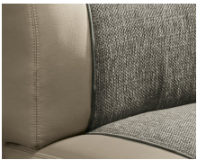
+ Tapicería Camino