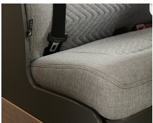
+ Tapicería Scandi