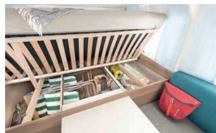
» Somier de láminas de madera con fijaciones de caucho, abatible para un aprovechamiento óptimo de los arcones debajo de las camas