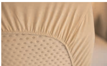
» Colchones de espuma fría en todas las camas gemelas y camas dobles.