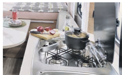
» Práctica cocina de 3 fuegos con encendido eléctrico