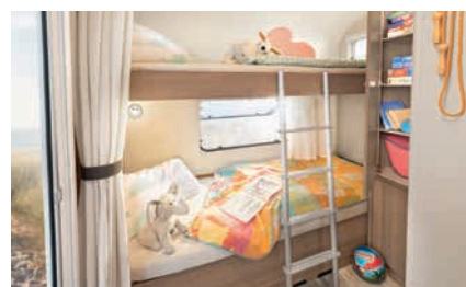
» De serie con 2 literas, disponible opcionalmente con un módulo de 3 literas (según modelo)