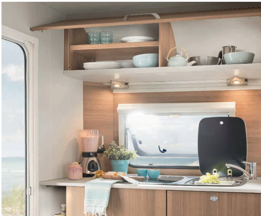
» Amplia cocina con grandes armarios altos