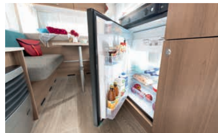
» Frigorífico de 81 l. con congelador de 10 l.