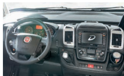
» Salpicadero con volante y palanca de cambios de piel, soporte para bebida en zona central y tablero de instrumentos con embellecedores cromados