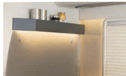
» Práctico y elegante: pared trasera iluminada de la cocina con protección lateral antisalpicaduras y estante para especias