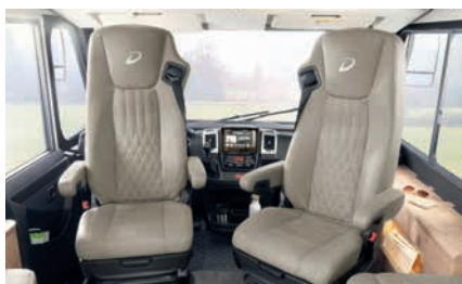
» Asientos de cabina deportivos SKA con suspensión neumática, así como ventilación y calefacción del asiento (opcional)