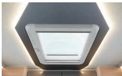
» Elegante claraboya en dormitorio con iluminación indirecta (incluido en GT-Paket opcional)