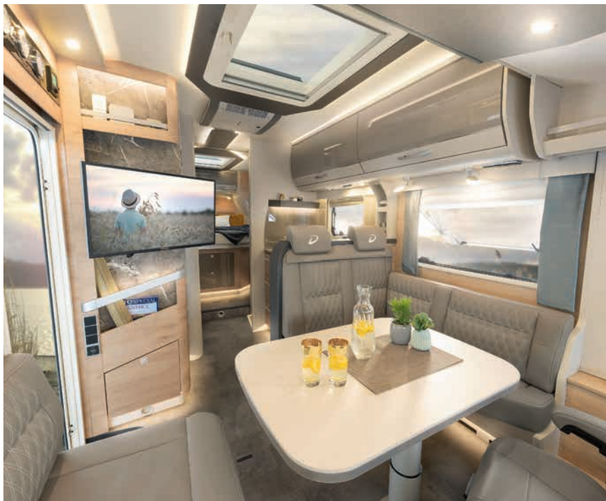
» Amplio y acogedor salón en L y composición de iluminación "Light Moments" (de serie)