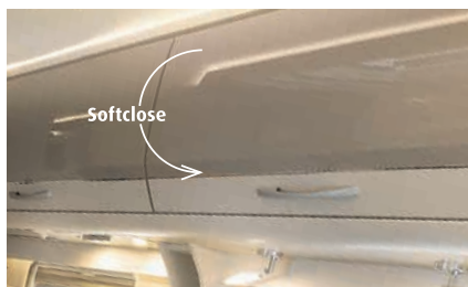
» Los armarios altillos iluminados con iluminación indirecta se integran en la cabina y cierran silenciosamente