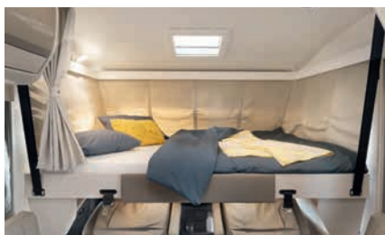
» Integral: máximo confort en la zona de descanso con una cama basculante de 195x150 cm.