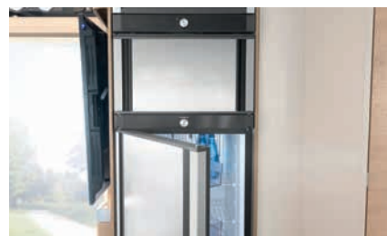
» Gran frigorífico de 177 l con horno integrado y puerta con doble apertura (opcional)