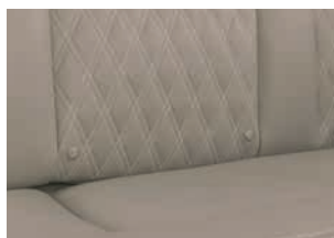
+ Rubino opcional