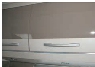
+ Nogal Nagano