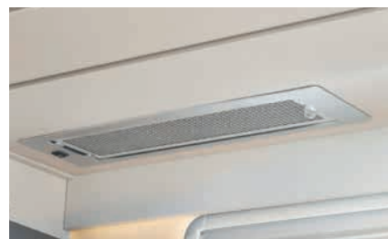
» Práctico extractor en cocina, sin entrada de aire procedente del exterior (de serie)