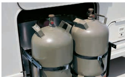
» Cómodo acceso a las bombonas de gas