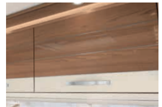
+ Fresno Almería Gloss (opcional)