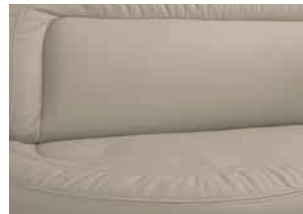
+ Meran (tapicería de piel, opcional)