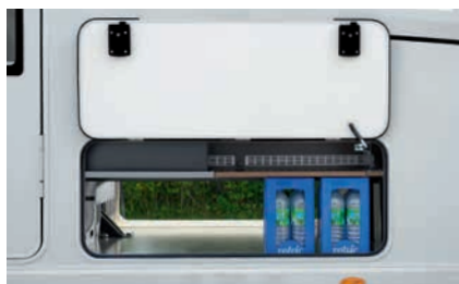
» Arcón en el doble suelo