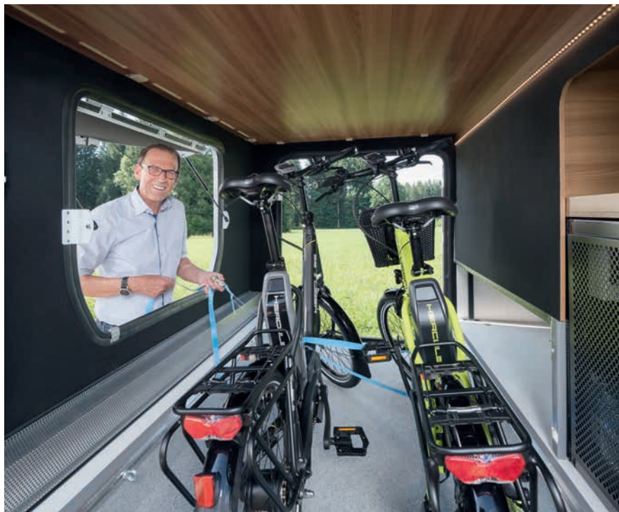
» Garaje de grandes dimensiones accesible, opcionalmente, por tres lados