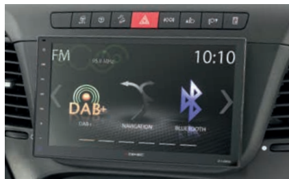
» Equipo multimedia: Naviceiver de Dethleffs incl. DAB+ (de serie)