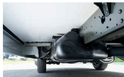
» Parte exterior del suelo revestido de GFK