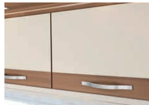
+ Fresno Almería White