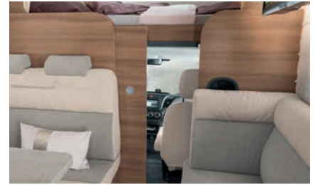
» La cabina se puede separar del salón mediante una puerta corredera