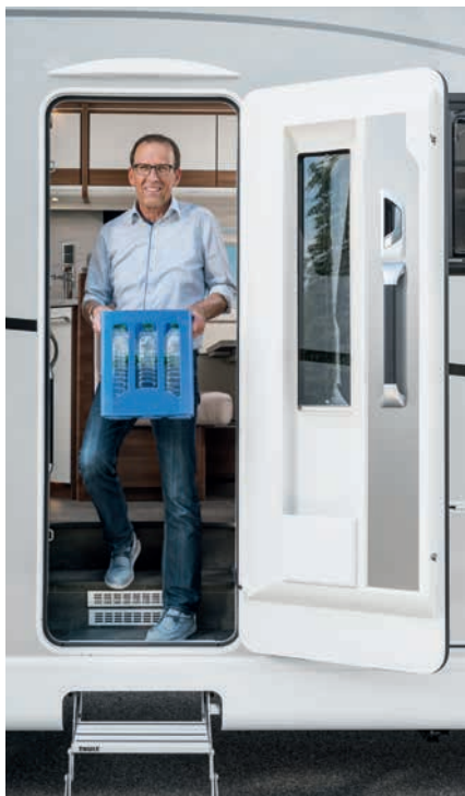
» Robusta puerta habitáculo con gran ventana