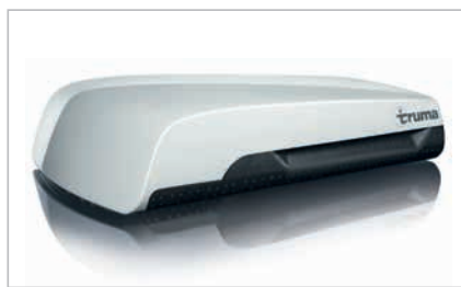
» Potente aire acondicionado en techo (opcional)