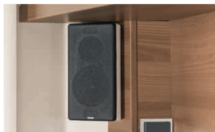
» Sistema de sonido (opcional)