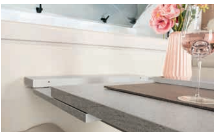
» Mesa extensible