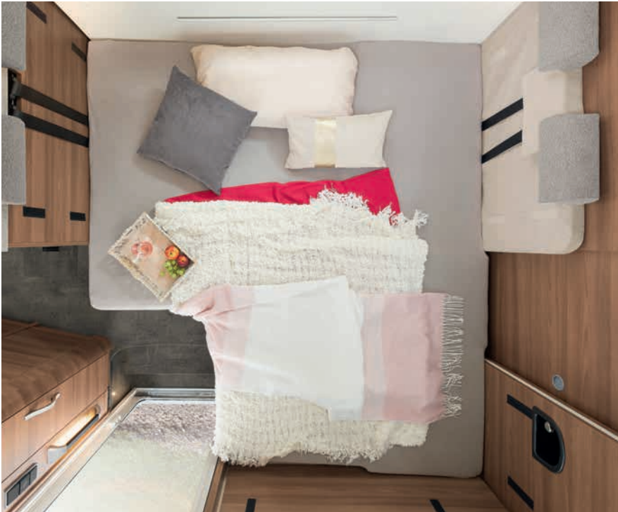
» Salón se convierte rápidamente en una cama doble