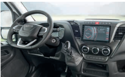
» Cabina con amplio equipamiento