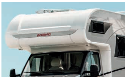
» Gran capuchina con una cama de 200 x 155 cm