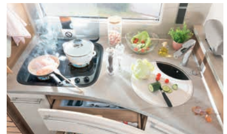
» Cocina con gran superficie de trabajo y práctica superficie para la cafetera