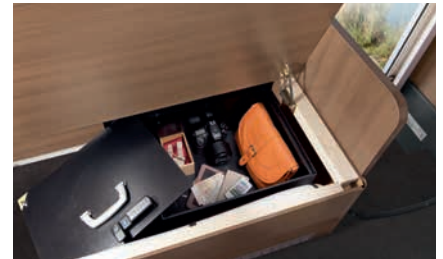
» Caja fuerte