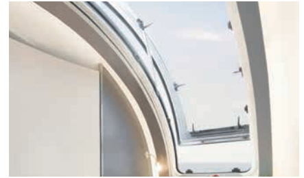
» Imponente ventana frontal abatible con mosquitera y oscurecedor plisado (Glamping-Paket)