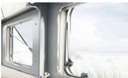
» Elegante revestimiento en ventanas con marco cromado (Glamping-Paket)