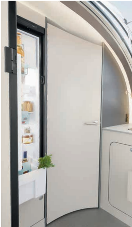
» Gran frigorífico de 142 l con congelador de 15 l.(incl. Lounge Up Paket)