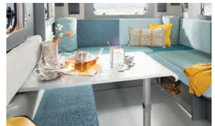
» Moderna mesa desplazable