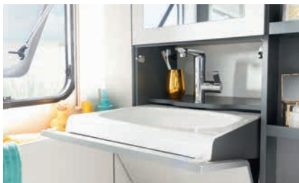
» Ahorrando espacio: práctico lavamanos abatible