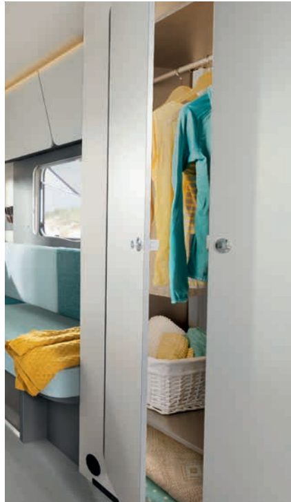
» Amplio armario ropero con barra y estantes