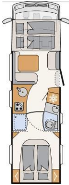
XLI 7820-2 DBM