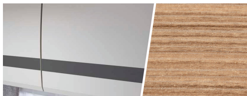
+ Rosario Cherry