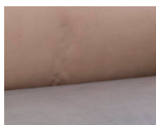
+ Tapicería Duke *