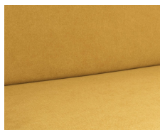
+ Tapicería Sunshine ○