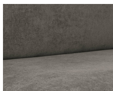
+ Tapicería Grey Orbit