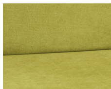
+ Tapicería Green Paradise ○