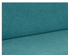
+ Tapicería Blue Lagoon ○