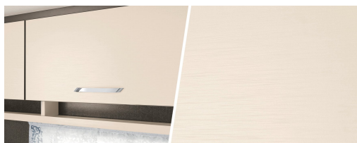
+ Diseño de madera Pearlwhite